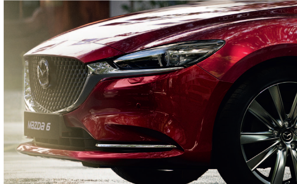
Foto links boven: Detailfoto van 19-inch lichtmetalen velg, Signature uitvoering Foto rechts boven: Mazda6 Sedan als Signature uitvoering in Soul Red Crystal Foto links: Detailfoto Japans Sen-hout, Signature uitvoering