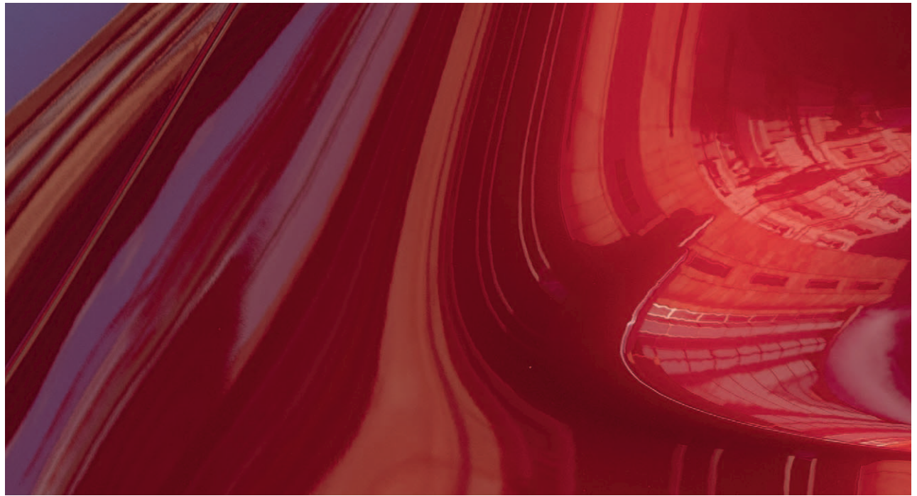
Soul Red Crystal