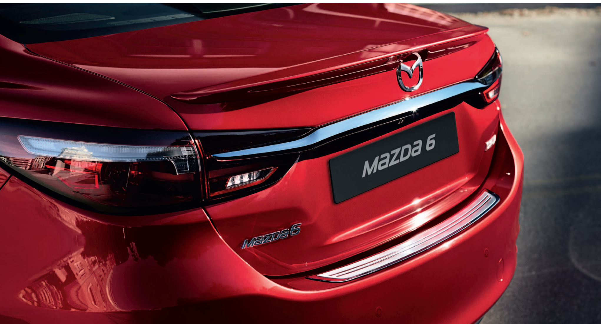
Mazda6 Sedan uitgerust met dealeropties; achterspoiler en beschermplaat achterbumper