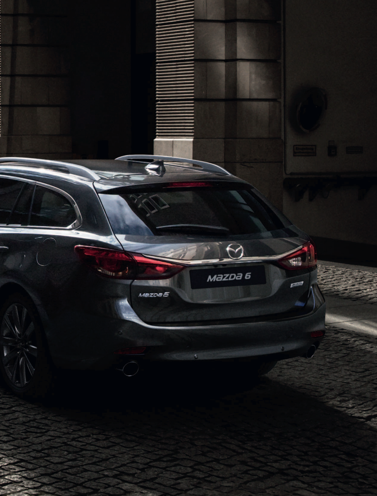
Foto links: Mazda6 Sportbreak als Signature uitvoering in Machine Gray