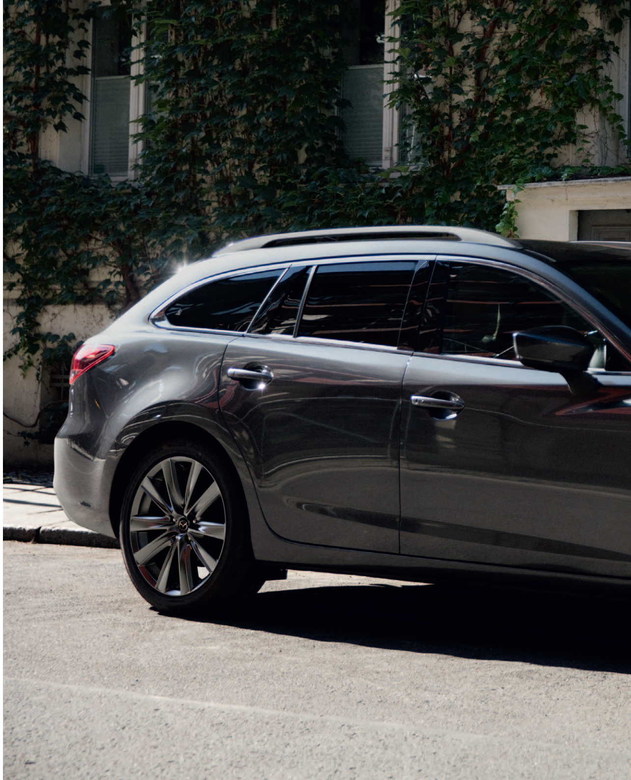
Foto rechts: Mazda6 Sportbreak als Signature uitvoering in Machine Gray