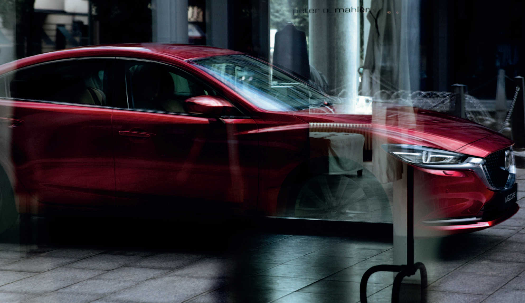
Foto : Mazda6 Sedan als Signature uitvoering in Soul Red Crystal