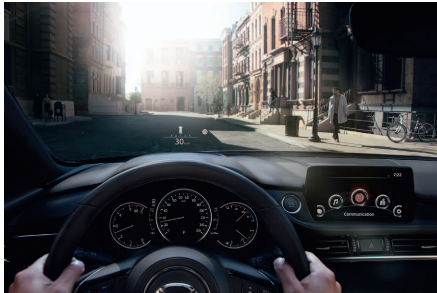
Foto boven : Mazda6 interieur met Active Driving Display (standaarduitrusting) en 7-inch digitale meterset (Luxury uitvoering).