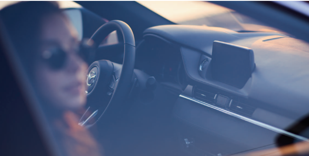
Foto rechts: Mazda6 Sedan als Signature uitvoering in Soul Red Crystal.

Elk detail is nauwkeurig met de hand ontworpen en vervaardigd met u in gedachten. Alles in het interieur van de Mazda6 valt samen. U ervaart nog sterker het gevoel van eenheid met de auto voor een unieke rijbeleving.